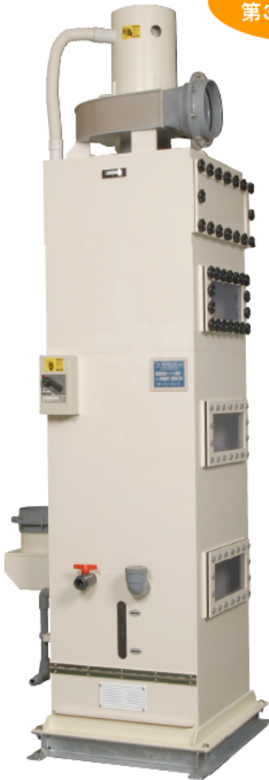
スーパークリーン SKH-10型(10m 3 /min)